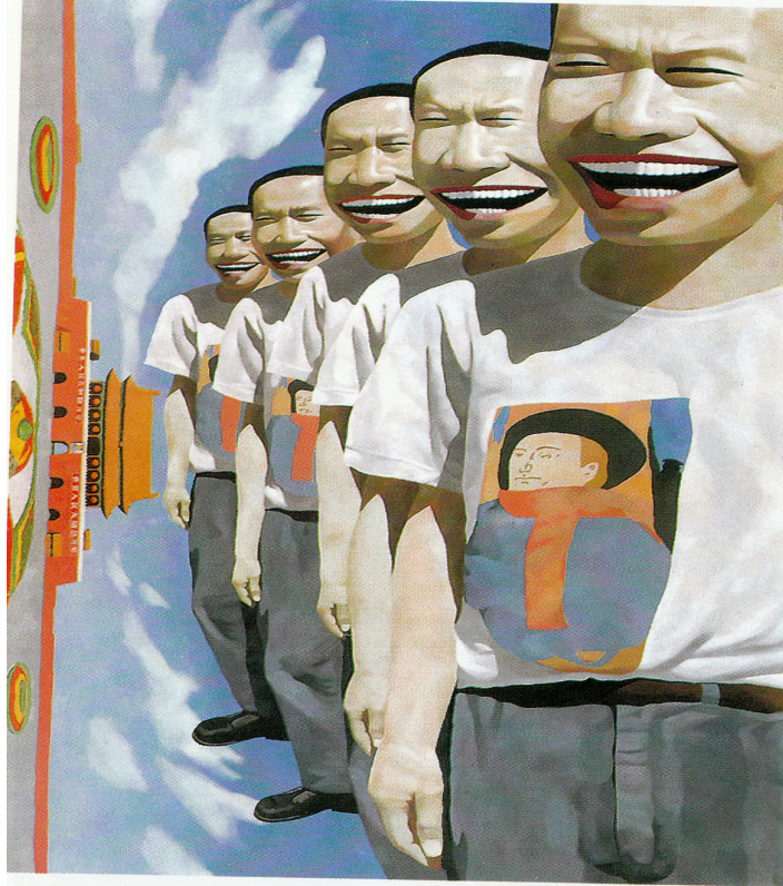
Minjun, "Drageflyvere". Olie på lærred, 1993.