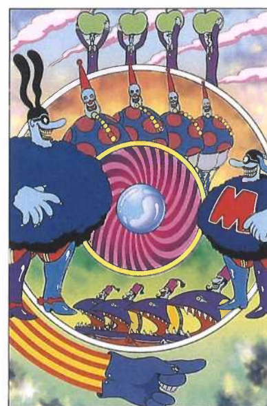
The Chief Blue Monster gathers his agents: the Bankers, Clowns, Snapping Turks, and the Dreadful Flying Olives!