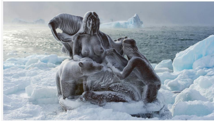
Skulpturen af "Havets Moder", som på grønlandsk hedder Arnaquassaaq, står uden for Nuuk i farvandet mellem Grønland og den internationale verden/farvand. Skulpturen er udført af Christian Nuunu Rosing.

Naturen har sine egne love, som vi ikke kan ændre. Det glemmer mennesker ofte. Vores klima- og miljøproblemer er et eksempel på, at vi mennesker står midt i naturen og ikke udenfor den.