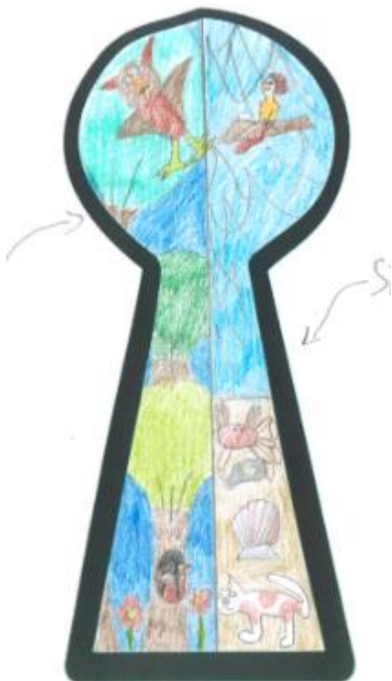
Tegn et billede hvor størrelsesforholdet er helt skørt